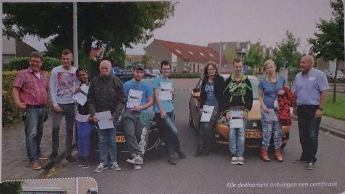
Alle deelnemers ontvingen een certificaat