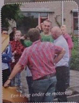
Een kijkje onder de motorkap